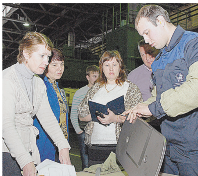
ЗА РАБОТОЙ. Теория плюс практика равно успех.