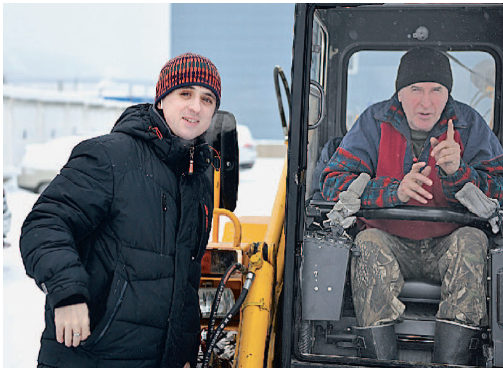
Всегда в движении, всегда при деле.

— Обеспечиваю бесперебойную работу участка благоустройства, параллельно осваиваю принципы и тонкости работы физкультурно-оздоровительного центра