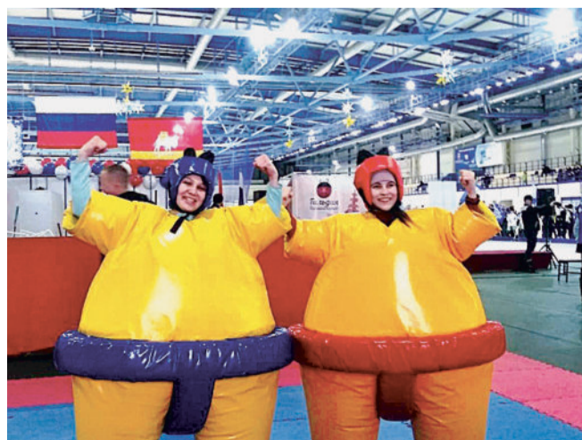
КТО НА НОВЕНЬКОГО?

Фестиваль делегацию АО «Златмаш» не разочаровал. В одной стороне азартно подбадривали участников забега на стометровках, в другой — до хрипоты требовали шайбу. Массовое катание, интерактивные площадки, преодоление полосы препятствий — каждый нашёл себе занятие по интересам. Для участников были проведены мастер-классы по конькобежному спорту,