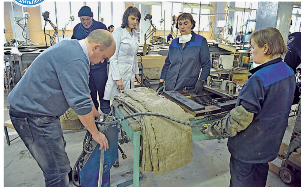
На сборке плиты идёт процесс внедрения изменений.

ФЦК ФЕДЕРАЛЬНЫЙ ЦЕНТР КОМПЕТЕНЦИЙ В СФЕРЕ ПРОИЗВОДИТЕЛЬНОСТИ ТРУДА