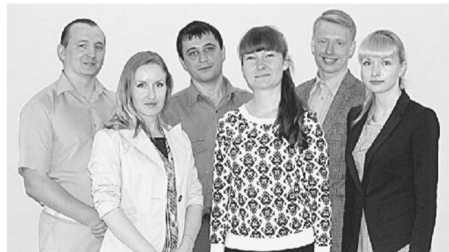
ОНИ СТАЛИ ПЕРВЫМИ. Шесть заводчан стали первопроходцами улучшений на предприятии.

Танков (цех № 13) в этот день сражались в командном брейн-ринге и мультииграх. Надо сказать, что наших участников несколько смутила швейцарская система, по которой проходил в этот раз брейн. Суть её заключается в следующем: при нечётном количестве команд та команда, которая не попала в пару, автоматически признаётся победителем. Угадываете: какие команды всегда были в парах? Правильно: «Суровые технари», «Резонанс» из ГРЦ и наша. Тем не менее, к чести организаторов можем сказать: столько вопросов на одну тематику не было никогда. Задания, касавшиеся исключительно космоса, приоткрыли участникам соревнований многие тайны его покорения. Например: по плану стыковка «Союз» — «Аполлон» должна была произойти над Москвой, но она произошла над Европой, но вместо наказания экипажу объявили благодарность, почему? Потому что стыковка произошла над Эльбой. Или во время разработки программы космического туризма выказывались пожелания об участии одной артистки, для которой космическая