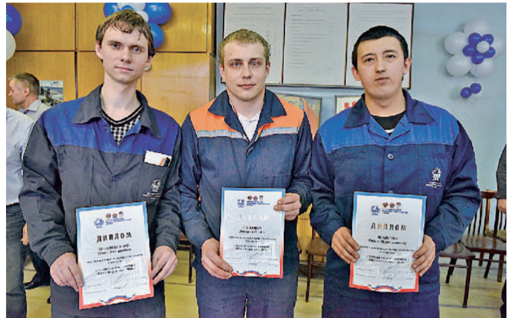
ЛУЧШИЕ ИЗ ЛУЧШИХ. В награду победитель и призёры получили дипломы и денежные премии.

Участвуя в предварительном голосовании «Единой России», мы формируем своё будущее!