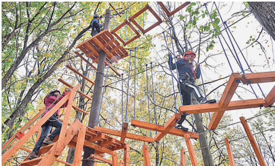
СЕРДЦЕ ЗАМИРАЕТ. Экстремальные маршруты расположены на трёх уровнях на высоте от одного до шести метров.

— Я боюсь высоты, но всё-таки смогла преодолеть свой страх и справи-