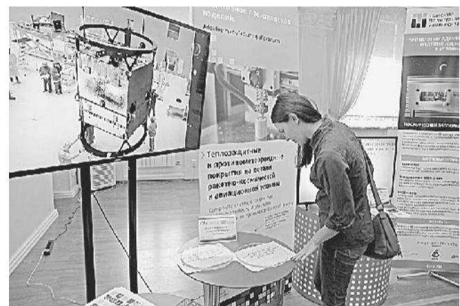
В выставочном центре.

В рамках деловой программы состоялись круглые столы «Сетевые образова-