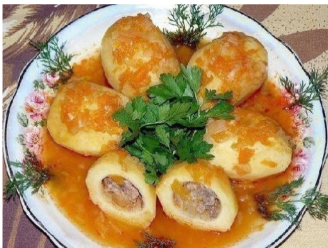
В меню — турша с картофелем и фаршем.